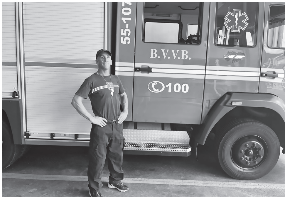
Como bombero voluntario, el Polaco desputa su deseo de ayudar

-Me contactaron otros bomberos de todo el país y llevé una bandera hasta la cima para luego dejarla en el refugio, para todo bombero que pueda llegar y firmarla y, llevar este mensaje de colaboración y concientización a los bomberos para mantener la preparación física. Ahora quiero cruzar la Cordillera de los Andes, de Argentina a Chile, llevando el mensaje que los bomberos voluntarios no tenemos fronteras.