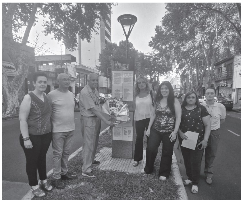
La comisión directiva del Círculo de Periodistas de Gral. San Martín colocó una ofrenda floral junto al monolito en San Martín, el primero que se erigió en el país en homenaje a J.L. Cabezas

El homenaje cerró con la colocación de una ofrenda floral junto al monolito que recuerda a José Luis Cabezas, el primero en ser erigido en el país.