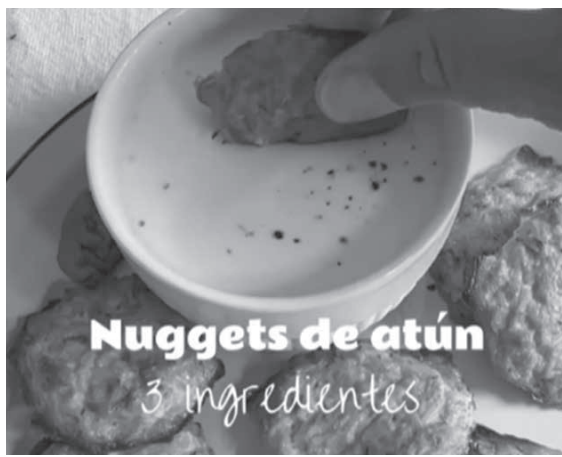
Nuggets de atún 3 ingredientes

Y listo, a disfrutar con los chicos alimentos que a veces son difícil de implementar en la dieta diaria.