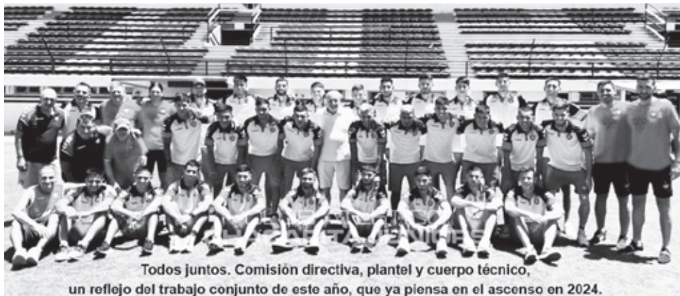
Todos juntos. Comisión directiva, plantel y cuerpo técnico, un reflejo del trabajo conjunto de este año, que ya piensa en el ascenso en 2024.

Este 2023 el Club de San Martín no logró la plaza para jugar en "Primera", pero las ganas y los esfuerzos están intactos para 2024.