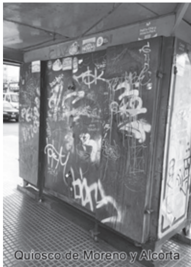
Quiosco de Moreno y Alcorta