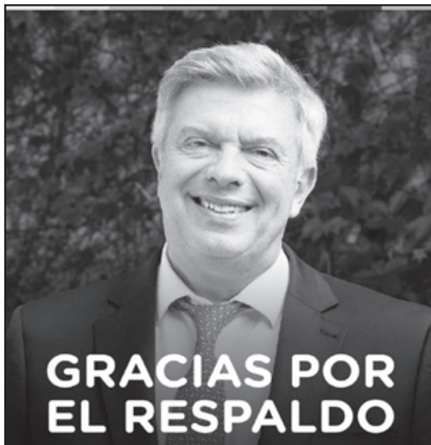
Moreira y D'Alessandro, por Unión por la Patria y Juntos por el Cambio, resultaron los más votados para ocupar la intendencia de SM

29.072 de la de Grosso, según el porcentaje de mesas escrutadas.