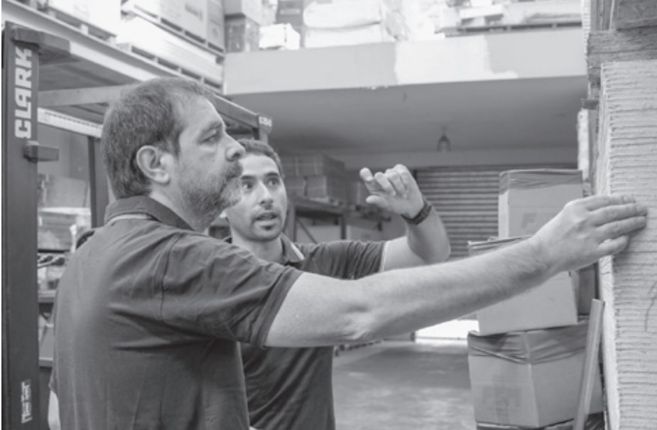
El intendente Fernando Moreira recorrió la PyME local Aislaciones Vima, que hace 50 años fabrica zócalos, aislaciones, cielorrasos y otros productos.

Además de los cursos ofrecidos por el MSM, a partir de acuerdos con las PyMEs locales se dan capacitaciones gratuitas según las necesidades de las empresas para promover el empleo local.