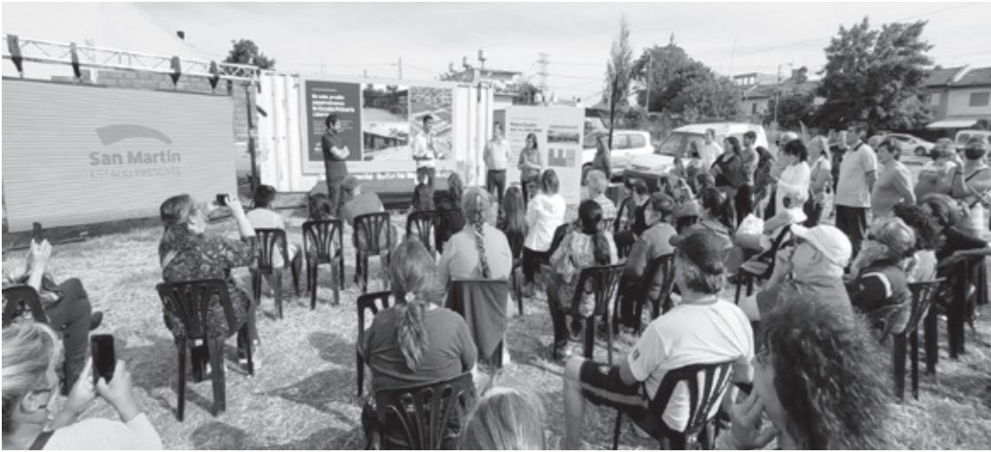
Ayer y hoy. Barrio Libertador ya tiene su escuela.