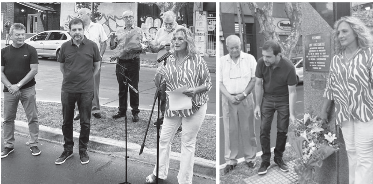
En el homenaje a J.L.Cabezas, junto al intendente municipal, la presidenta del Círculo de Periodistas resaltó “el compromiso con la libertad de expresión como derecho ciudadano”.

El Círculo de Periodistas de San Martín homenajeó al reportero gráfico José Luis Cabezas, a 26 años de su asesinato. Su presidenta resaltó que fue “un crimen político y el mensaje mafioso más siniestro” y aseguró que “la democracia se construye trabajando todos los días y sobre todo con memoria, verdad y justicia”.