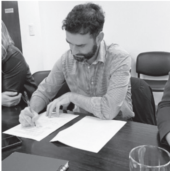
en Latinoamérica”, expresaron desde prensa del bloque.

“Los mismos muestran solidaridad democrática inter- nacional a cada uno de los vecinos del Partido de Ge- neral San Martín de estos tres países que dejaron de dejar su tierra, donde fueron expulsados por estas dictaduras, y reafirman su compromiso para seguir siendo una voz que trabaje por la restauración de la democracia y la paz