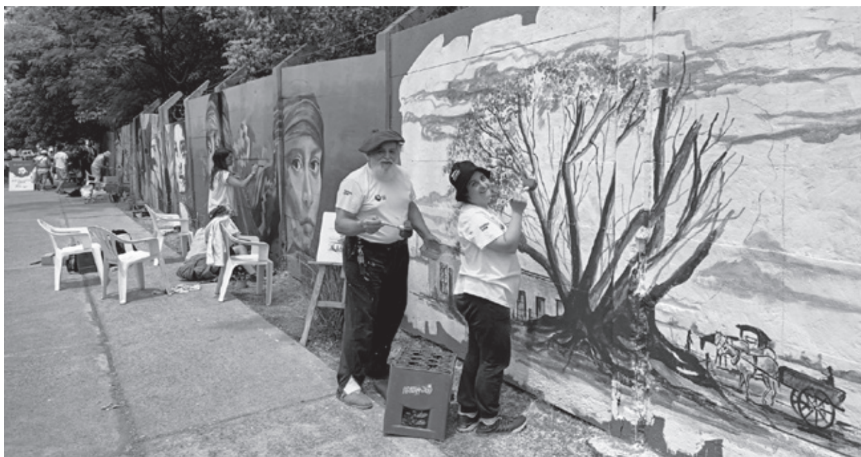
Máscaras de Villa Maipú.

Tras la apertura el jueves 10, Día de la Tradición, el viernes 11 se llevó a cabo la Noche de los Museos, con un circuito por el Liceo Militar y los museos Casa Carnacini, José Hernández, Juan Manuel de Rosas, Casa Mercado, el Archivo Fotográfico Alejandro Witcomb y el Museo de