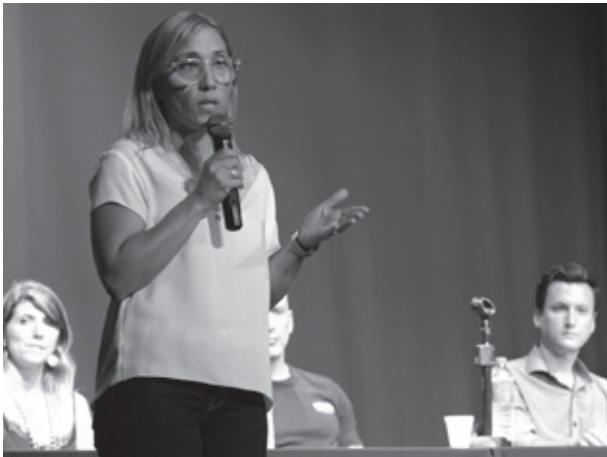
Mercedes Contreras, Subsecretaria de Derechos Humanos e Igualdad de Oportunidades, en el cierre del ciclo.

El ciclo se llevó a cabo de forma virtual, organizado junto a la Secretaría de Extensión Universitaria UNSAM y contó con la participación de más de 2.000 personas de manera virtual.