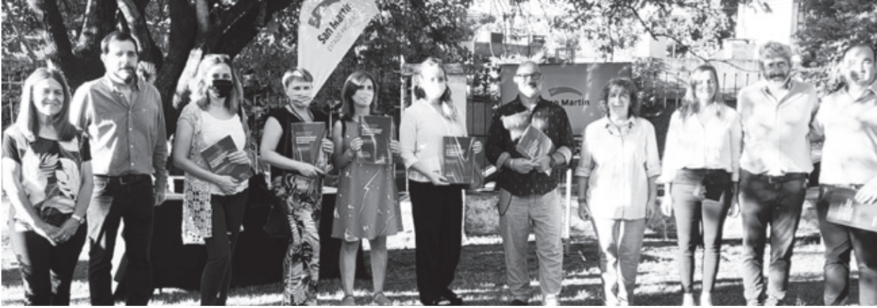
Durante el acto, algunas de las empresas presentes se sumaron a la firma de la carta de adhesión para implementar el Manual de Buenas Prácticas por la Igualdad de Género y el Protocolo Violencia Cero.

El intendente Moreira destacó a las PyMEs locales como el "motor de nuestra ciudad" y alentó al sector empresario a seguir trabajando en conjunto. "La pandemia no terminó", agregó, "pero estamos saliendo de a poco".