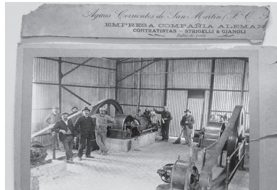
Trabajadores de la usina de Aguiar Corrientes de San Martín, 1908

Ese progreso, sin embargo, no fue un regalo del azar, sino el fruto de la lucha incansable de militantes socialistas, anarquistas, radicales y peronistas que, en cada fábrica y unidad básica, defendieron la dignidad laboral y conquistaron derechos que hoy son pilares de nuestra democracia.