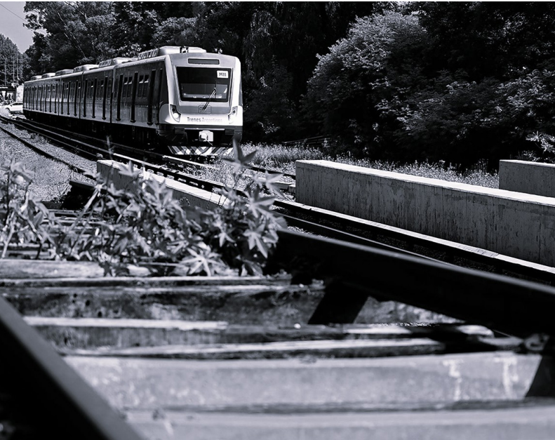
Ya comenzó el proceso licitatorio para completar el 55% faltante de la obra del paso bajo nivel de la Av. Perdriel, que promete revalorizar la zona y mejorar el día a día de los vecinos que transitaban el cruce o viven en la zona.