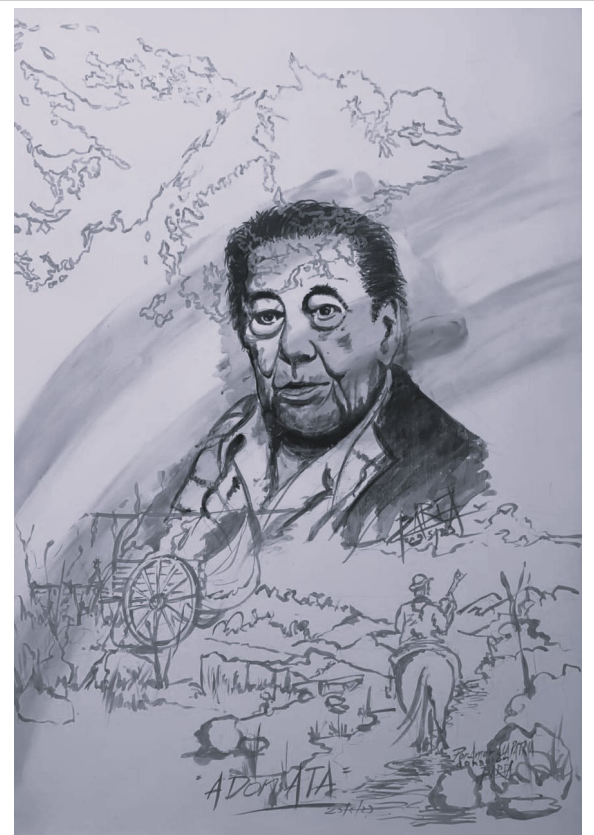
"A Don Ata", de Omar Barea, patrimonio del Museo y Fundación "Atahualpa Yupanqui"

La obra, realizada en acrílicos, 1m x 0,70, poesía ilustrada, integra imágenes de las obras más conocidas de Atahualpa, como Hermanita Perdida, Los ejes de mi carreta, Cerro Colorado y El payador perseguido.