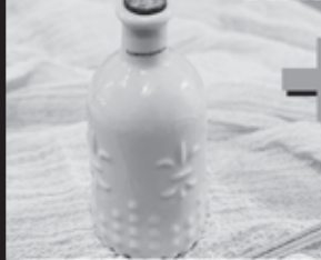
Difusor de varillas, aromatizador de ambiente.