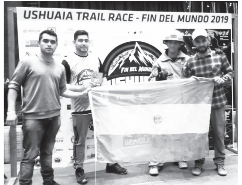
En Ushuaia, con bomberos del cuartel 2 de abril.